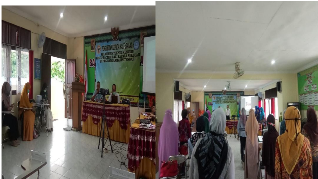
Gambar 2: Kegiatan pembukaan pelatihan

Kegiatan selanjutnya adalah pembukaan. Pembukaan kegiatan oleh ketua PKG Banjarmasin Tengah serta perkenalan dari tim pengabdian dan menyanyikan lagu Indonesia Raya, berikut dokumentasi untuk kegiatan pembukaan (gambar 2).