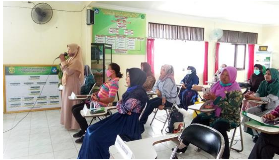
Gambar 5: Diskusi dan Tanya jawab

Pelatihan hari kedua diawali dengan materi penyusunan Best Practice oleh narasumber (gambar 6).