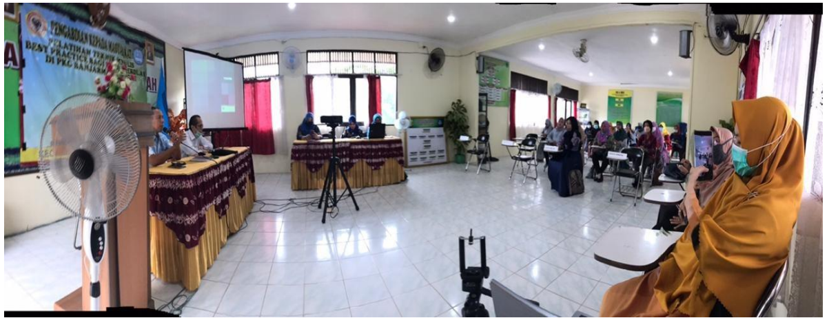
Gambar 3: Pemaparan materi I

Setelah istirahat pemaparan materi dilanjutkan yaitu ciri-ciri Best Practice yang dapat dilihat pada (gambar 4) yang dapat dilihat pada (gambar 5) serta dengan diskusi dan tanya jawab dari analisis masalah yang ditemukan masing-masing peserta (gambar 6)