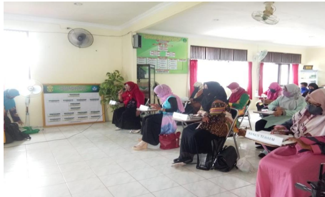
Gambar 7: Tanya Jawab