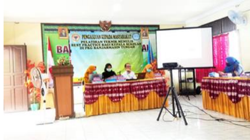
Gambar 6: Pemaparan materi III

Pelatihan hari kedua diawali dengan materi penyusunan Best Practice oleh narasumber (gambar 6).