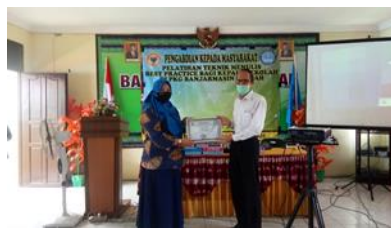
Gambar 8: Kegiatan Penutup