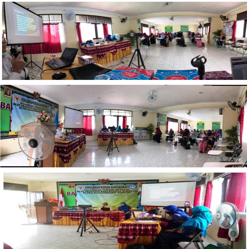
Gambar 4: Pemaparan materi II

Setelah istirahat pemaparan materi dilanjutkan yaitu ciri-ciri Best Practice yang dapat dilihat pada (gambar 4) yang dapat dilihat pada (gambar 5) serta dengan diskusi dan tanya jawab dari analisis masalah yang ditemukan masing-masing peserta (gambar 6)