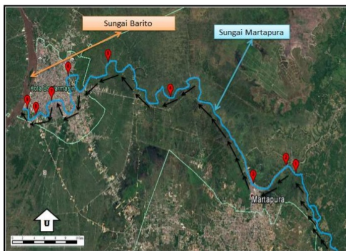
Gambar 1 Daerah pengambilan sampel sedimen Sungai Martapura (Dimodifikasi dari ...)

Lokasi pengambilan sampel sedimen berada di sepanjang Sungai Martapura Kalimantan Selatan (Gambar 1). Sampel sedimen diambil pada bulan Agustus 2018 dengan menggunakan sediment grab sebanyak 9 titik. Titik sampel dipilih berdasarkan keadaan lokasi sampel, diantaranya daerah dengan banyak pemukiman warga, daerah pertanian, daerah dengan keadaan ramai lalu lintas sungai dan muara Sungai Martapura. Di