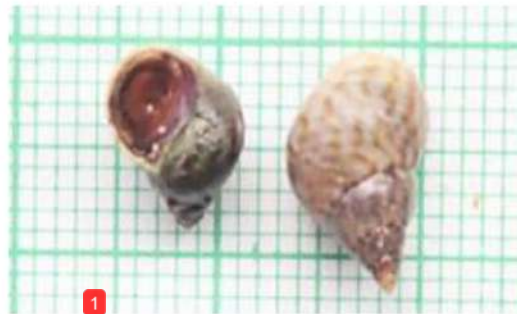
Littoraria angulifera Lamarck, 1822