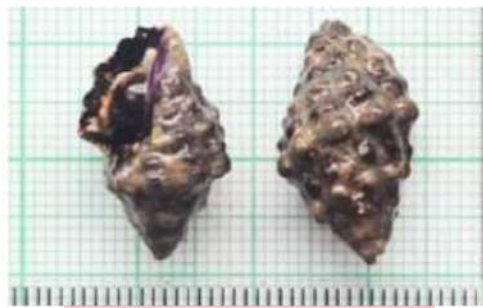
Neothais marginatra Blainville, 1832