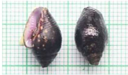
Strombus sp. 2