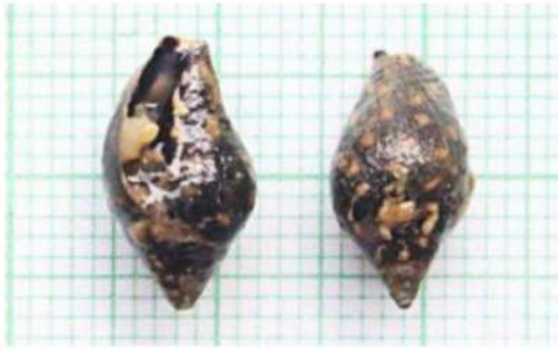
Strombus sp. 1