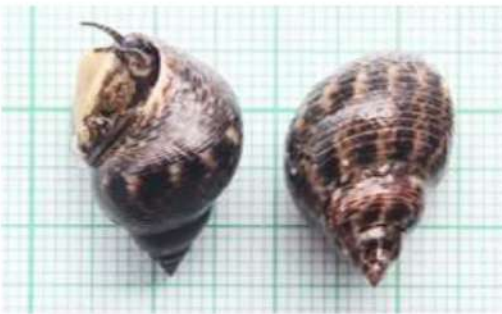
Littoraria scabra Linnaeus, 1758